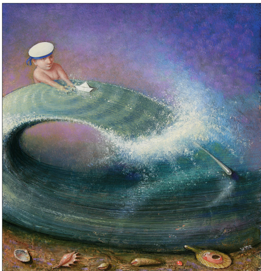
"Boog" 2006 tempera & alkyd/karton op paneel 23 x 22 cm