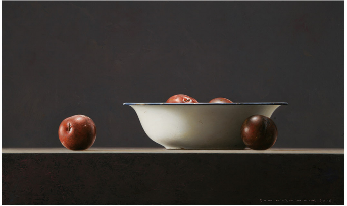
"Wit Schaaltje met pruimen" 2016 olieverf/paneel 30 x 50 cm