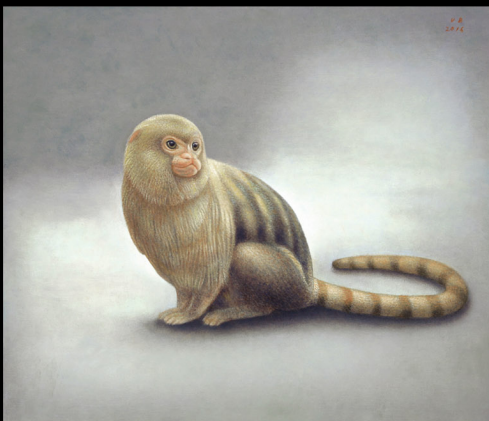
"Artis III - het Dwergzijdeapje" 2016 olieverf/paneel 30 x 35 cm