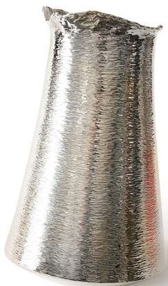
"Water in Evenwicht" 2009 zilver 925 Ø 18 cm, hoog 28 cm unicum