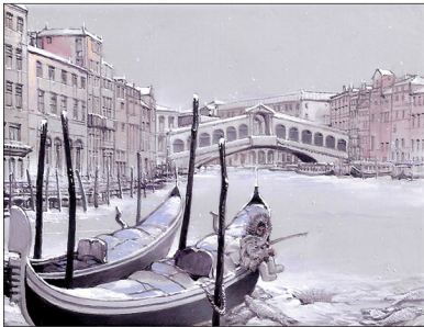
"Venetiaans Ijs X - Catch of the Day" 2017 olieverf/paneel 5,2 x 6,6 cm