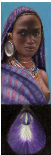
"Black Pearl II - Met bloem" 2017 olieverf/koper 15 x 5 cm