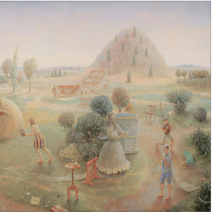
"Sporen van Beschaving" 2016 olieverf/paneel 56,5 x 91,5 cm