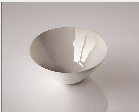
"Schaal uit Egmond" 2004 olieverf/doek 45 x 55 cm