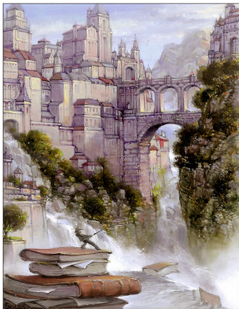
"Venetiaans Ijs IX - On the Rocks" 2017 olieverf/paneel 3,3 x 9,2 cm