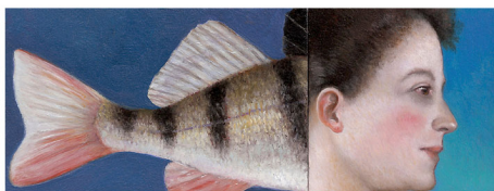
"Visvrouwtje" 2017 olieverf/koper 5 x 13 cm