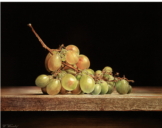
"Groene Druiven" 2017 olieverf/paneel 6 x 46 cm