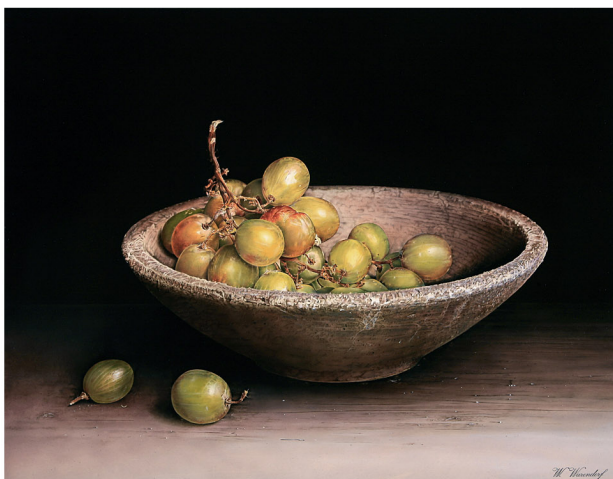
"Kom met Groene Druiven" 2017 olieverf/paneel 40 x 52 cm