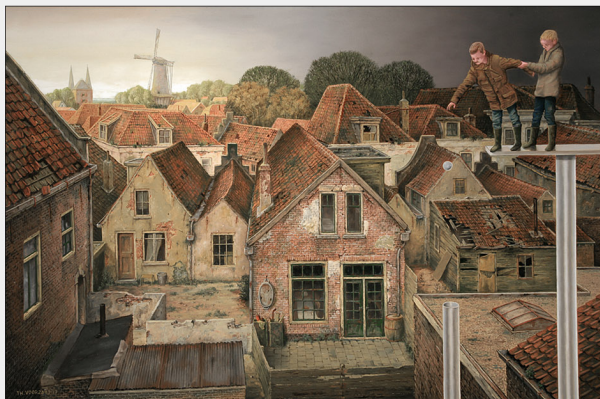
"Zeelandbrug" 2017 olieverf/paneel 42 x 63 cm