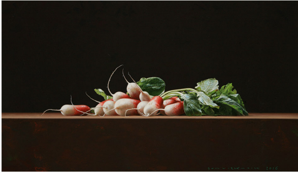
"Radijsjes" 2016 olieverf/paneel 23 x 40 cm