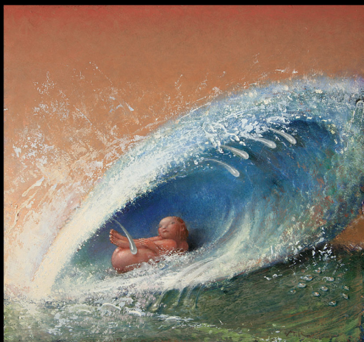
Peter van Poppel "Geboorte van Venus - Waterschelp" 2006 tempera & alkyd/karton op paneel 19 x 20 cm