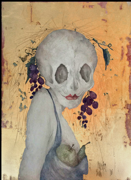
"Bacchante met Appel en Peer" 2016 eitempera/karton 36,5 x 26 cm