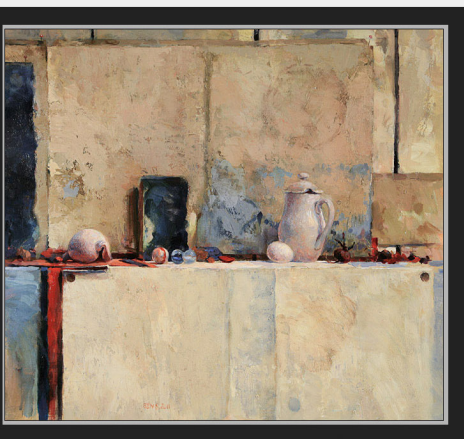
"Tweeliek met Brandaris" 2011 acryl/papier op paneel 43 x 49 x 100 cm