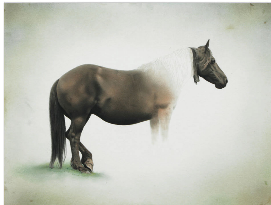
"Caballo" 2015 kleurpotlood/papier op karton 34,5 x 45,5 cm