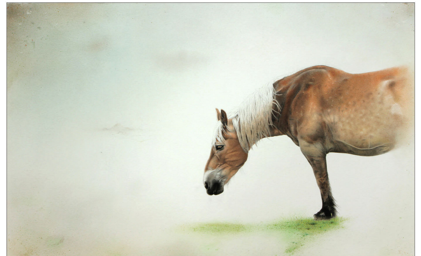
"Half Paard" 2015 kleurpotlood/papier op karton 41 x 66 cm