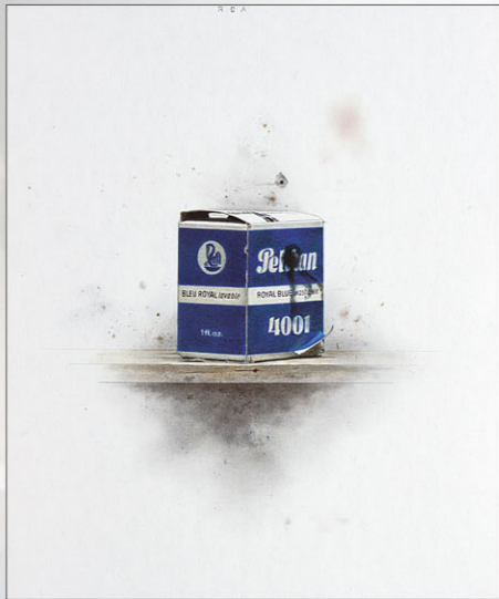
"Pieza 21 - Pelikan" 2017 kleurpotlood/papier op karton 27 x 22 cm