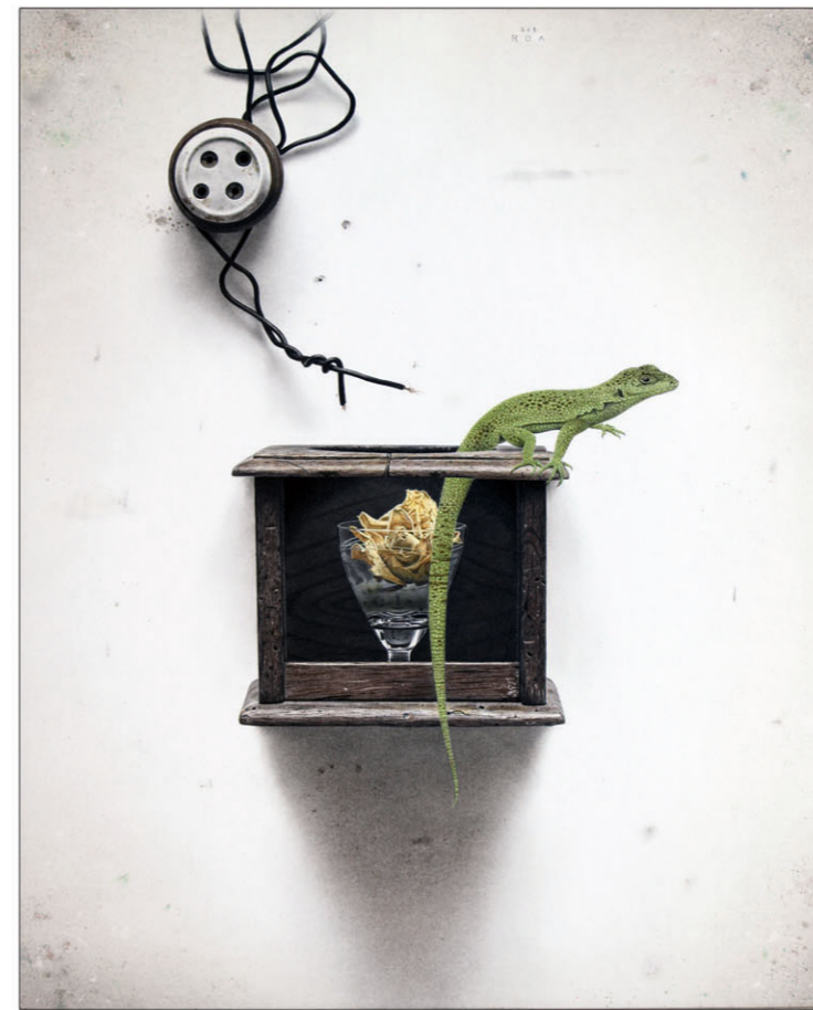
"Lagarto" 2016 kleurpotlood/papier op karton 43 x 35 cm