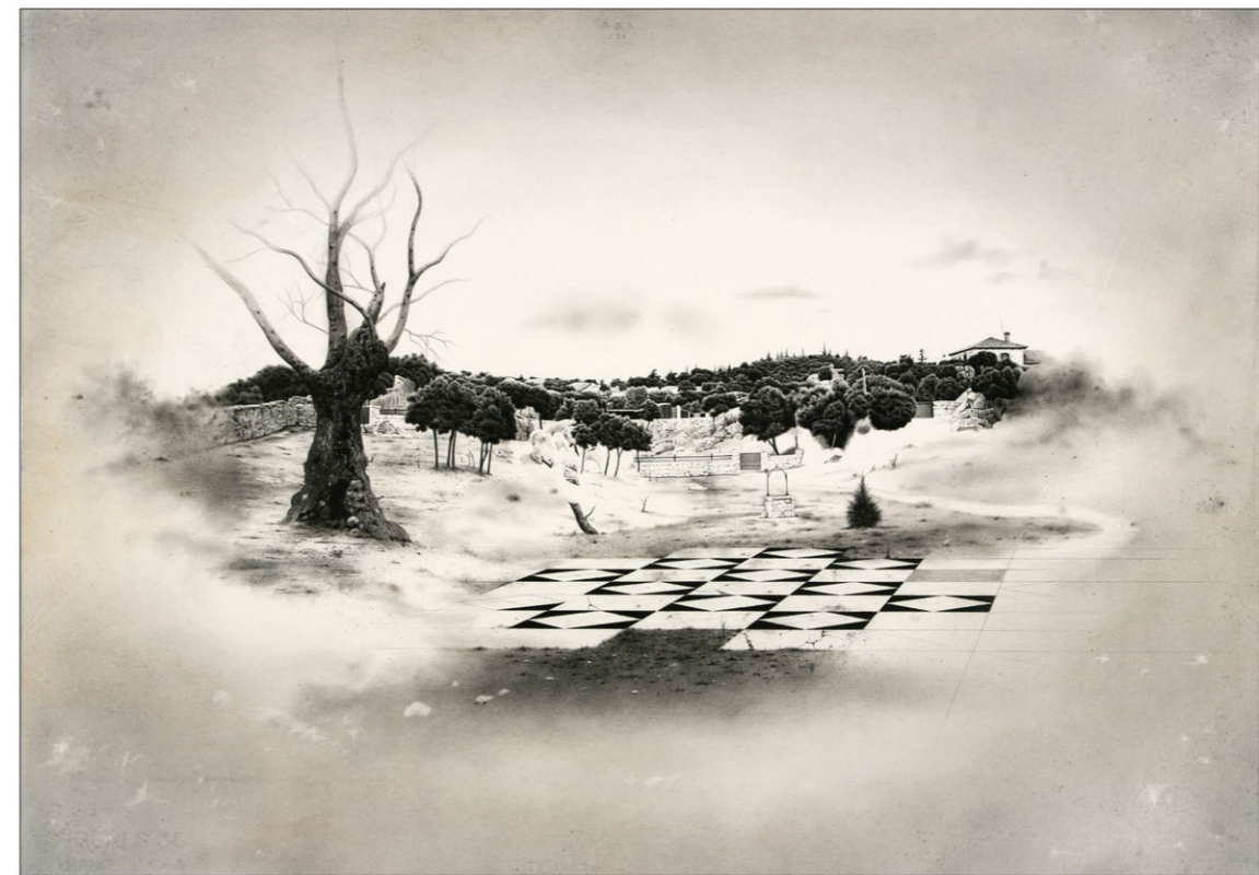
"Hoyo" 2021 potlood/papier op karton 53 x 75 cm