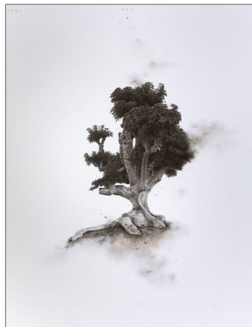
"Ombuboom" 2017 kleurpotlood/papier op karton 45 x 34 cm