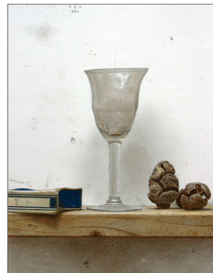
"Nr 3" 2024 gemengde techniek/papier op karton 25,5 x 20 cm