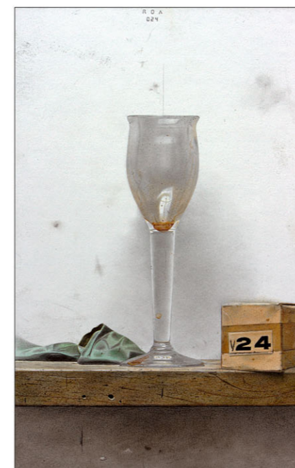
"24" 2024 gemengde techniek/papier op karton 22 x 48 cm