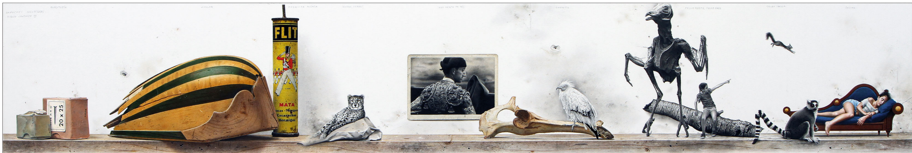
"Continuo III" 2024 gemengde techniek (o.a. potlood)/papier op karton 24 x 146 cm