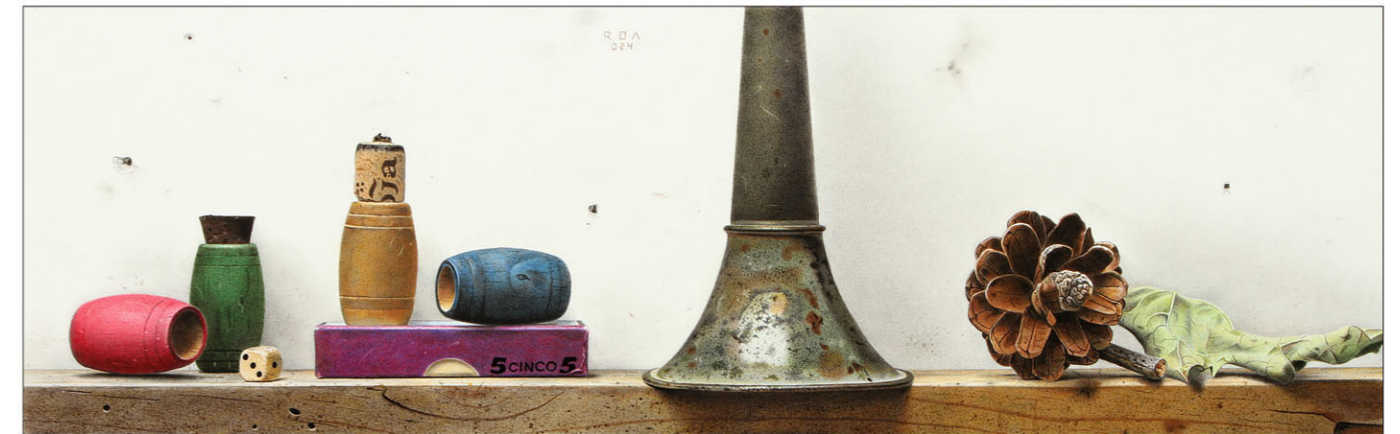
"5 Cinco 5" 2024 gemengde techniek/papier op karton 16 x 50 cm

The nub of the matter is that Francisco Roa in his still lifes re-creates the world into a cacophony of objects, in numbers that are far greater than the handful of boxes I mentioned before. The art critic who owns up to not caring for still lifes “because the genre is totally devoid of action” certainly makes things difficult for him or herself. Although in all honesty I quite admire the sincerity of such a statement, at the same time I appreciate the good fortune that has befallen me in that alongside the almost unimaginable tranquillity of compositions by someone like Olav Cleofas van Overbeek, who needs nothing more than a single grey bowl (could there be a more unassuming shape?) to put an almost tangible block of contemplation to canvas, there is a still life painter such as Roa (even though he works in pencil, black and white or colour and uses other techniques as well) who with maximum yet serviceable precision zooms out to a colourful range of diverse paraphernalia each of which represents a “Gesamtkunstwerk” in its own right.