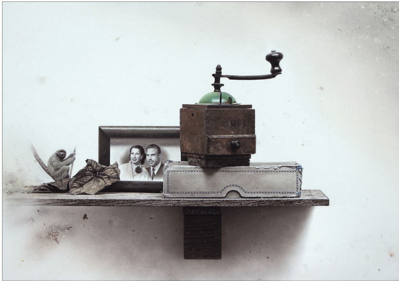
"Perezoso" 2016 kleurpotlood/papier op karton 50 x 71 cm