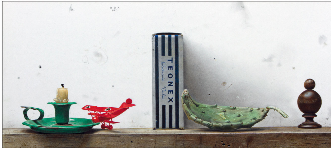
"Teonex" 2024 gemengde techniek/papier op karton 24 x 53,5 cm