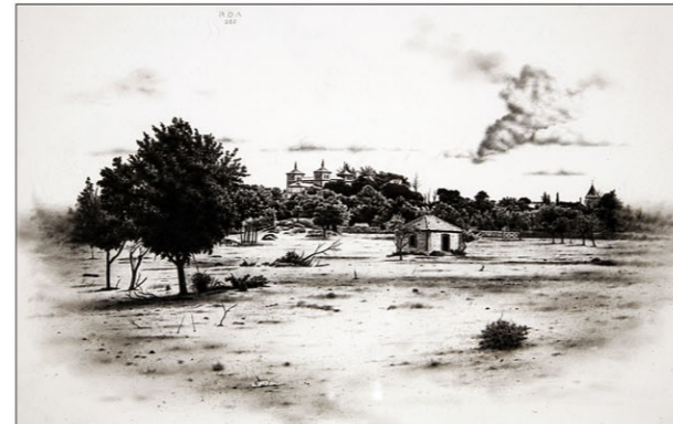
"El Escorial" 2022 potlood/papier op karton 21 x 33 cm