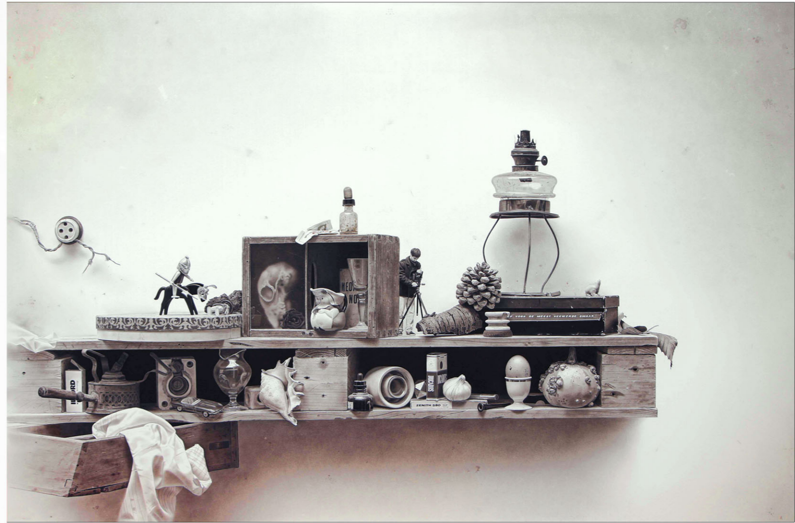
"Stilleven met Kalebas" 2020 potlood/papier op karton 97 x 146 cm