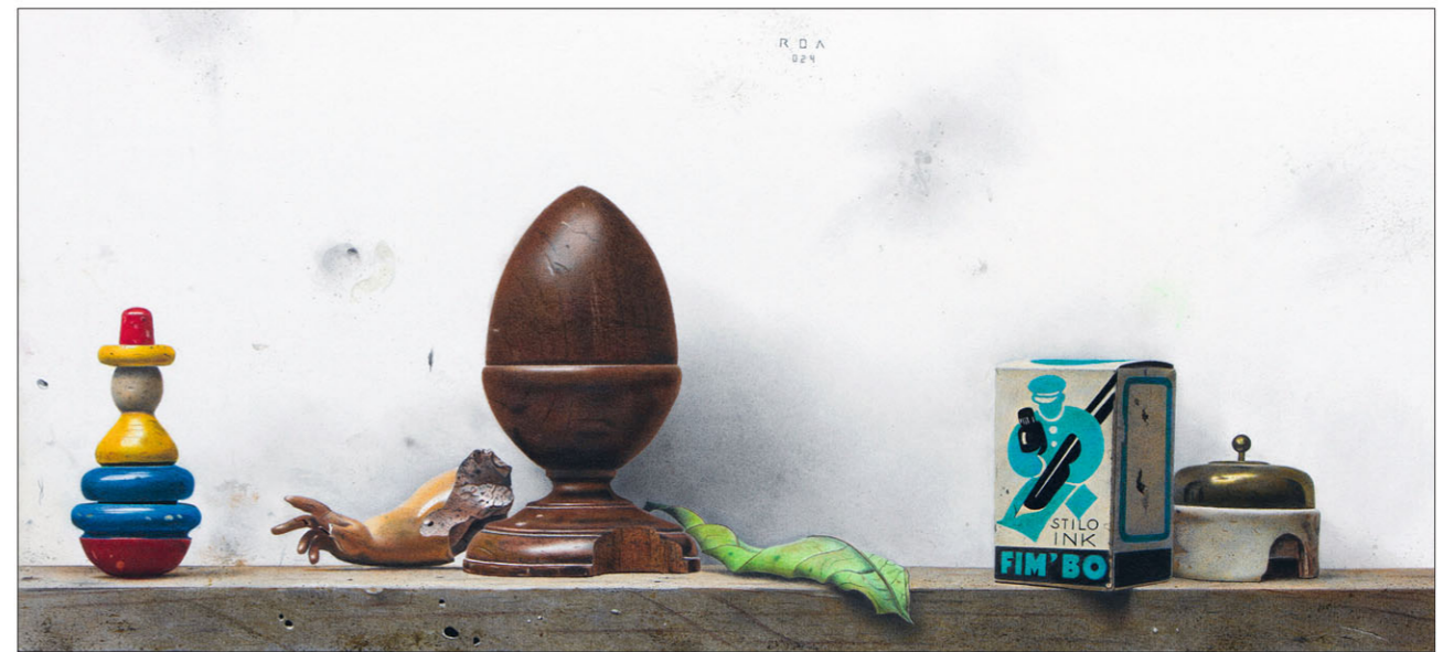
"FIM'BO" 2024 gemengde techniek/papier op karton 22 x 48 cm

Het kan overigens ook omgekeerd. Ik heb boeken gelezen van de Spaanse schrijver Carlos Ruiz Zafón, en zowaar, in zijn verhalen ontwaar ik bij vlag en wimpel iets van de parallelwereld die ook via de tekeningen van Roa is te betreden, al was het maar door het beeldrijm tussen het rafelige papier en karton van de doosjes en de tand des tijds die boeken voorziet van de sporen van de bladerende handen en de tranen van de lezers - ik verwijs hier naar het boek De gevangene van de hemel , het derde van een vierluik, waar een magische bibliotheek een hoofdrol speelt.