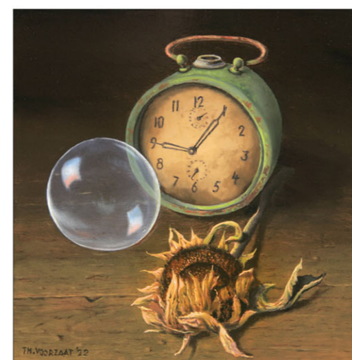
"Zonnebloem" 2022 olieverf/paneel 15 x 15 cm