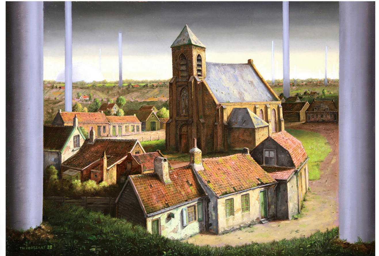
"Zoutelande" 2022 olieverf/paneel 31 x 44,5 cm