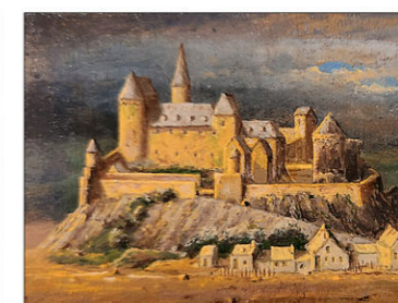
"Valkenburg" 2022 olieverf/paneel 4 x 6 cm