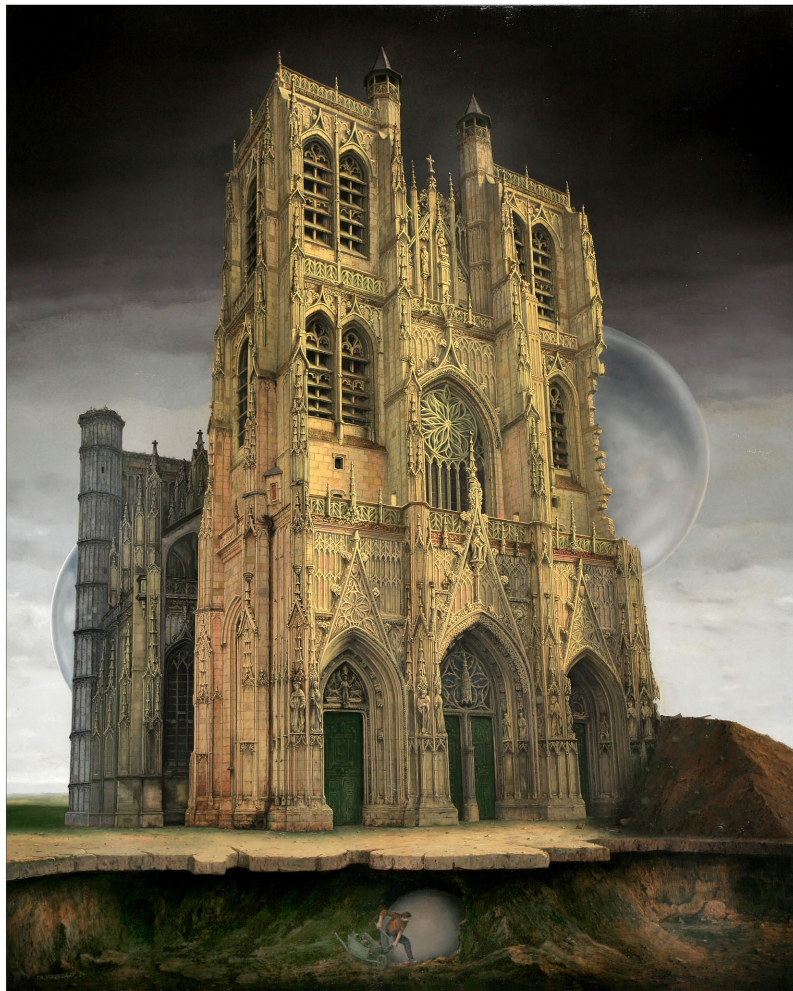
"Kerk in Abbeville (F)" 2024 olieverf/paneel 122 x 88 cm