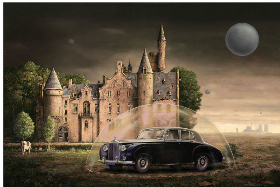
"Kasteel Marnix van St. Aldegonde" 2022 olieverf/paneel 54,7 x 81,4 cm