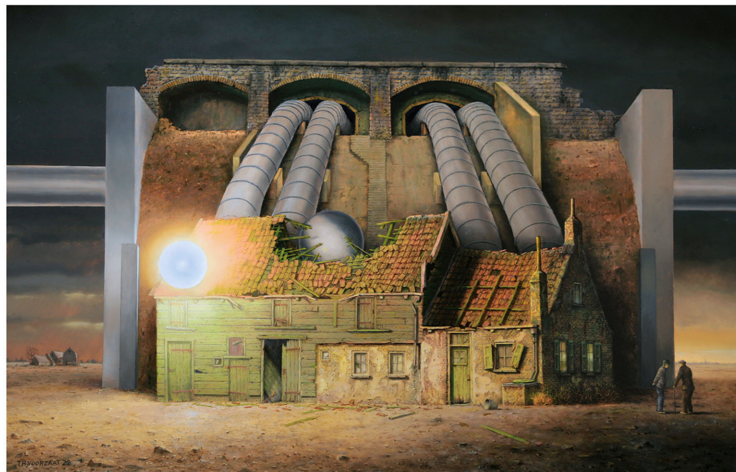
"Skuur in Dreischor" 2022 olieverf/paneel 48 x 74 cm

Hoewel in het geval van Voorzaat de verwerking van het oorlogstrauma een zeer bijzondere draai heeft gekregen, in de vorm van een imposant oeuvre van schilderijen, waarin hij zich volledig afwendt van in de kunstwereld als gebruikelijk veronderstelde aanpassing aan een van bovenaf opgelegde zowel inhoudelijke als vormtechnische norm - ik aarzel dit zo te benoemen, omdat het er zo de schijn van heeft dat ik me permitteer een minder gunstig oordeel te formuleren over de gedragingen van anders geöriënteerde kunstenaars, terwijl het me er eigenlijk om gaat om het indringende idioom van Theo Voorzaat te relateren aan een van de grootste rampen die de wereld in de vorige eeuw is overkomen, waarvan in de naoorlogse beeldende kunst erg weinig is terug te vinden, of het moet zijn dat ook in de kunsten het devies "vooruitkijken, niet achterom" werd omarmd. Geen woord van kritiek, maar wat zou het fijn zijn als een kunsthistoricus zich liet inspireren door dit onontgonnen onderzoeksgebied.