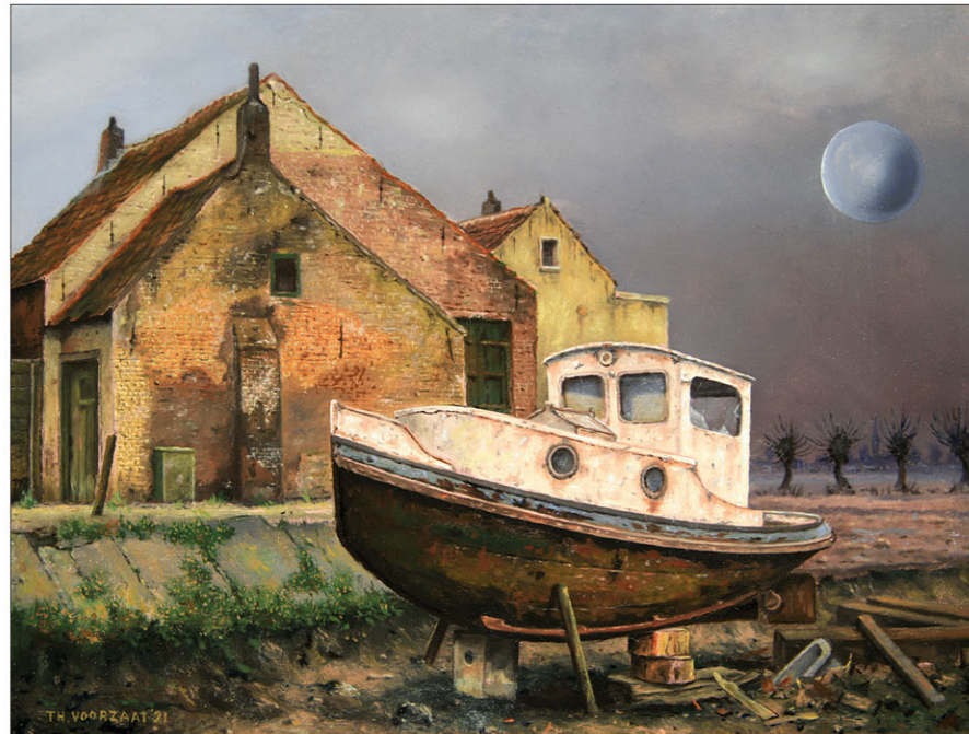
"No Return XVIII" 2021 olieverf/paneel 19 x 25 cm

H oe ver we in Europa ook zijn gekomen met het realiseren van een als normaal beschouwde politieke logistiek op grond van democratische waarden, ergens in dat proces is onvoldoende klaarheid gebracht in de risico's van een transitie naar die democratische waarden vanuit een voorheen totalitair gekleurde landspolitiek, een transitie die burgers en politieke systemen uit eigen beweging het hoofd moeten bieden, voordat zij de zin inzien van een onvoorwaardelijke overgave aan die waarden. Om het nou maar even afstandelijk te benoemen, het kost tijd daaraan te wennen en afstand te nemen van voorafgaande reactiepatronen en politieke normen, zoals die eeuwenlang, en dus geschiedenisboeken vol, gebruikelijk waren: aanvallen als er winst mee te behalen viel. Zo beschouwd zitten we in Europa middenin een proces van een definitieve transitie naar vreedzame oplossingen. Wat ik hier verwoord is niet nieuw, maar de sprong van de oprichting van de Europese Gemeenschap voor Kolen en Staal (EGKS) in 1952 naar de huidige mondiale positie van de Europese Unie, hoeveel kanttekeningen je daarbij ook kunt maken, is ontzagwekkend. Dat er desondanks oorlogen woeden is onderdeel van de onvermijdelijk ook pijnlijke kanten van het proces dat vooruitgang heet.