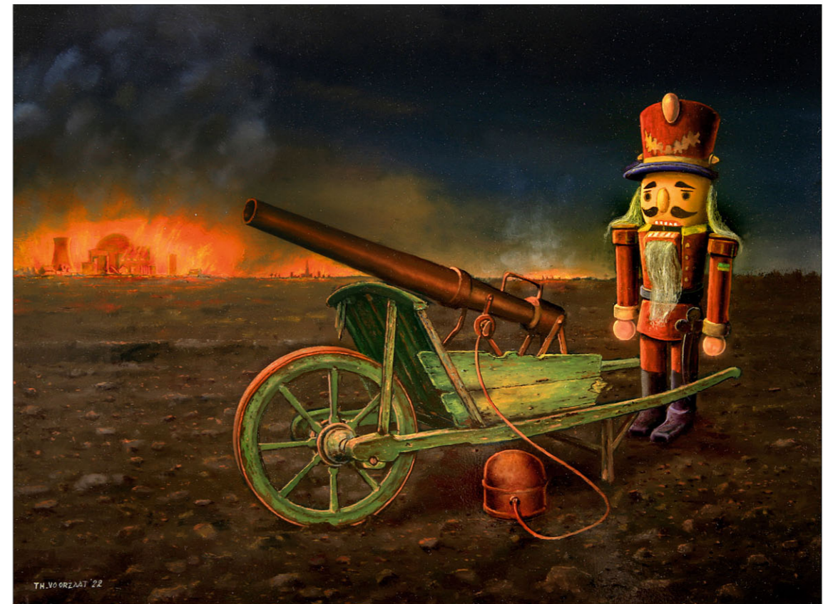
"Bittere Ernst" 2022 olieverf/paneel 30 x 40 cm