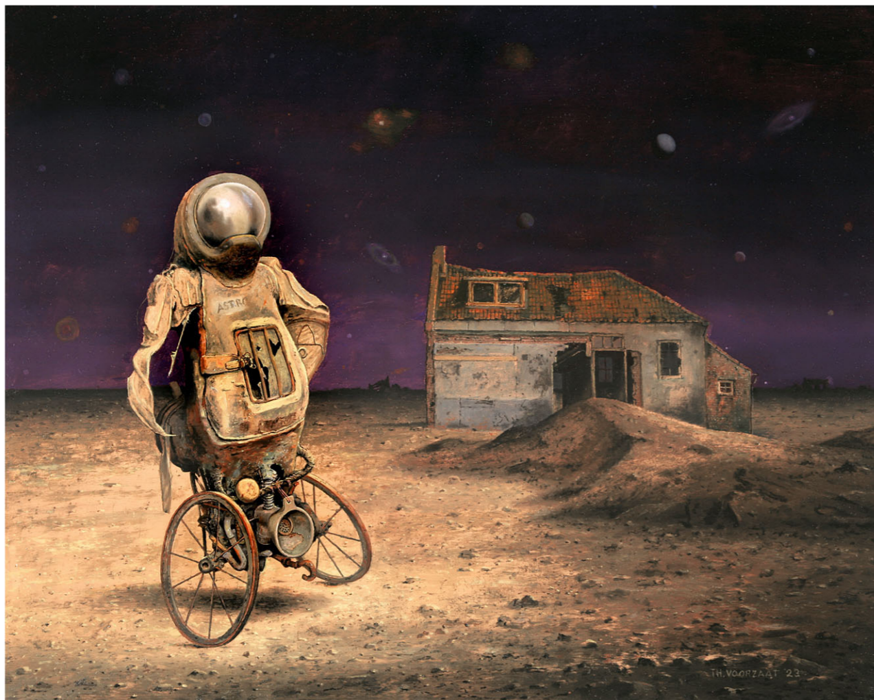
"Astronaut" 2023 olieverf/paneel 40 x 50 cm