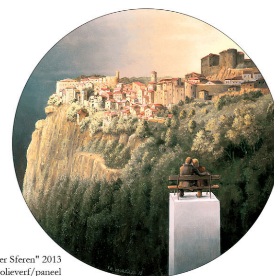
"In Hoger Sferen" 2013 olieverf/paneel Ø 14,1 cm