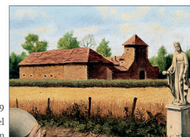
"Dreischor" 1979 olieverf/paneel 5 x 7 cm