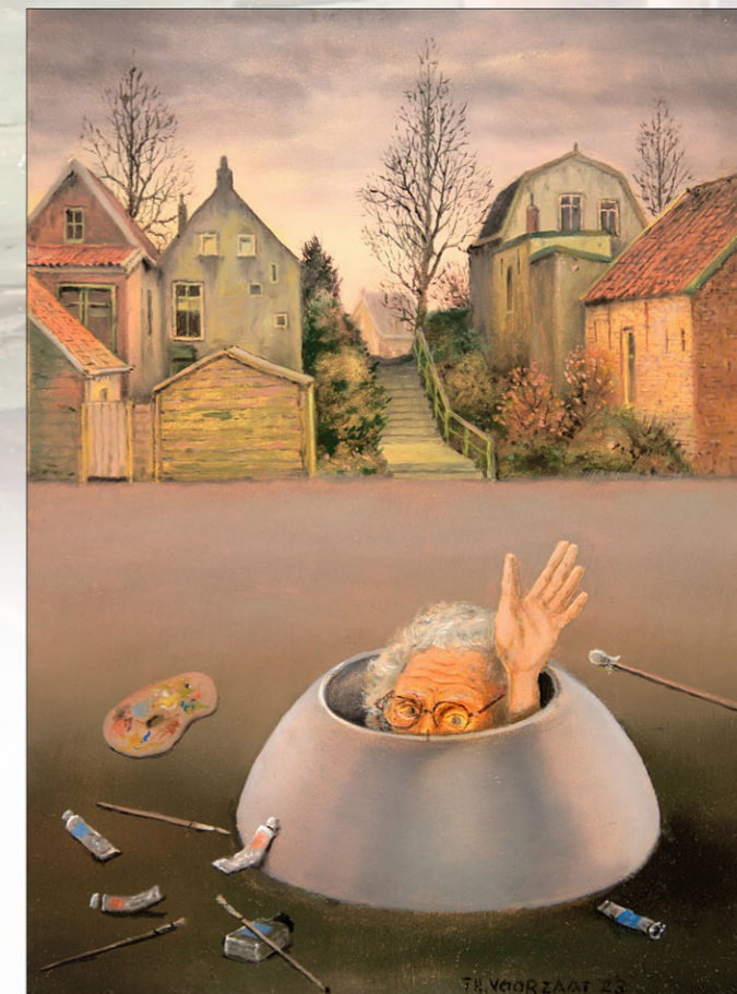
"Dag!" 2023 olieverf/paneel 18 x 12,9 cm

Cover: uitsnede uit "Bittere Ernst" Bitter Seriousness - see page 5 2022, olieverf/paneel, 30 x 40 cm