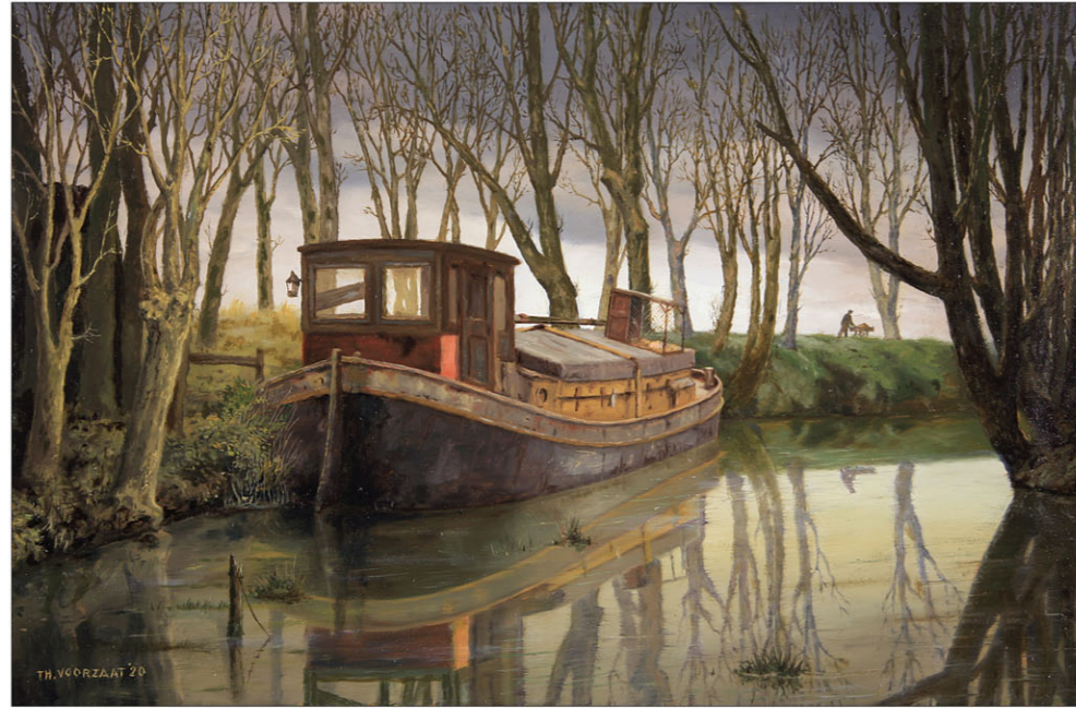
"Woonboot in Pieterburen" Houseboat at P. 2020, olieverf/paneel 22 x 32,5 cm