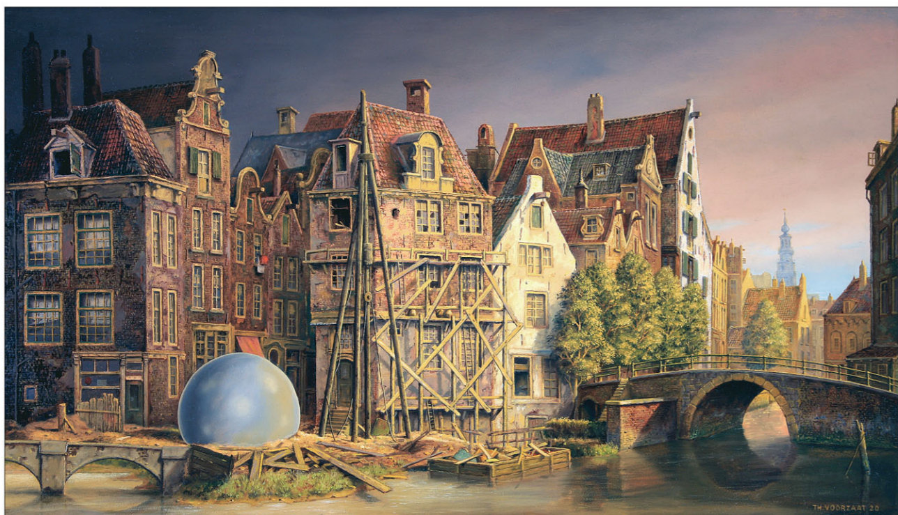
"Amsterdam, Vroeger" 2016 olieverf/paneel 27,5 x 38,5 cm

In de context van het werk van Theo Voorzaat gaat het me om iets anders. Eenmaal wetend hoe ingrijpend de verschillen van beleving tussen Voorzaat en mijzelf vermoedelijk zijn, kijk ik alsnog met andere ogen naar zijn schilderijen. Maar vooralsnog niet geordend, omdat ik inmiddels ook weet dat het aangrijpen van een hoofdlijn onverlet laat dat er nog zoveel herinneringen en verwachtingen een rol spelen, dat een keurig en logisch totaalplaatje buiten mijn en andermans bereik blijft - bij nader inzien maar goed ook. Het verhaal van de verbeelding kent geen orde, ook al is de oorsprong dikwijls een ervaring, die dan mag fungeren als de realiteit. Het mooie van beeldende kunst is dat je kijkt naar een van de manieren waarop mensen terugkijken op wat hen is overkomen, of dat nou logisch oogt of niet. In het persoonlijk universum dat Voorzaat zichzelf toestaat na het meemaken van al die ellende lijkt hij nostalgie de taak te geven om de herinnering te voeden - wat je je herinnert was er, is er of komt weer, of juist niet, tastbaar of niet - en in één adem door de melancholie van het voorbij te treffen, want je kunt herbouwen wat je wilt, het wordt nooit meer zoals het was. En verdraaid, wat ik al heel lang weet maar nu beter begrijp is waarom Voorzaat niet dol is op gerestaureerde gebouwen en die hij, niet zelden, als ze toch een plaats in zijn schilderijen krijgen, in olieverf autoriseert door alsnog natuurlijk ogende littekens van de tand des tijds aan te brengen.