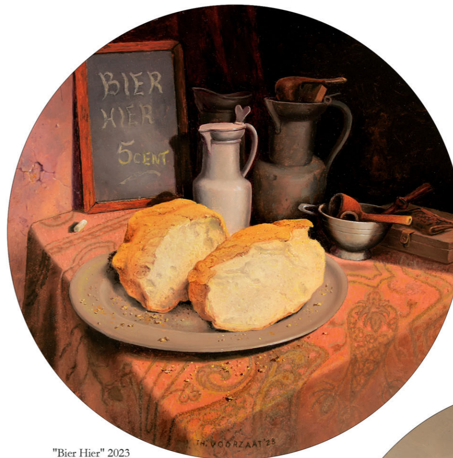
"Bier Hier" 2023 olieverf/paneel Ø 29,8 cm