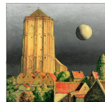
"Zierikzee" 2023 olieverf/paneel 8 x 8 cm