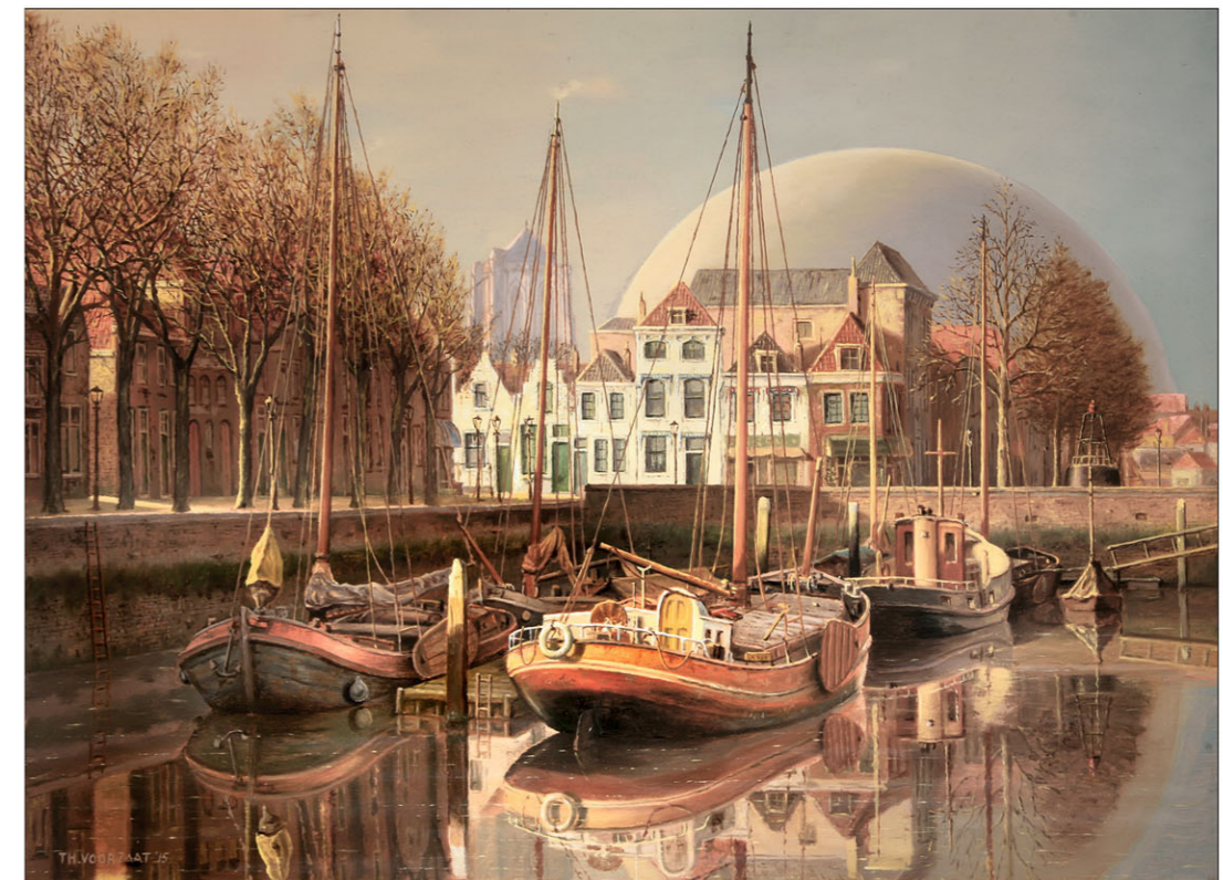
"Oude Haven te Zierikzee" (Zierikzee's Old Port) 2015, olieverf/paneel 23,7 x 32,5 cm

H oe ver we in Europa ook zijn gekomen met het realiseren van een als normaal beschouwde politieke logistiek op grond van democratische waarden, ergens in dat proces is onvoldoende klaarheid gebracht in de risico's van een transitie naar die democratische waarden vanuit een voorheen totalitair gekleurde landspolitiek, een transitie die burgers en politieke systemen uit eigen beweging het hoofd moeten bieden, voordat zij de zin inzien van een onvoorwaardelijke overgave aan die waarden. Om het nou maar even afstandelijk te benoemen, het kost tijd daaraan te wennen en afstand te nemen van voorafgaande reactiepatronen en politieke normen, zoals die eeuwenlang, en dus geschiedenisboeken vol, gebruikelijk waren: aanvallen als er winst mee te behalen viel. Zo beschouwd zitten we in Europa middenin een proces van een definitieve transitie naar vreedzame oplossingen. Wat ik hier verwoord is niet nieuw, maar de sprong van de oprichting van de Europese Gemeenschap voor Kolen en Staal (EGKS) in 1952 naar de huidige mondiale positie van de Europese Unie, hoeveel kanttekeningen je daarbij ook kunt maken, is ontzagwekkend. Dat er desondanks oorlogen woeden is onderdeel van de onvermijdelijk ook pijnlijke kanten van het proces dat vooruitgang heet.