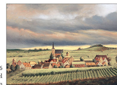
"In de Elzas" 2016 olieverf/paneel 6,7 x 9,3 cm