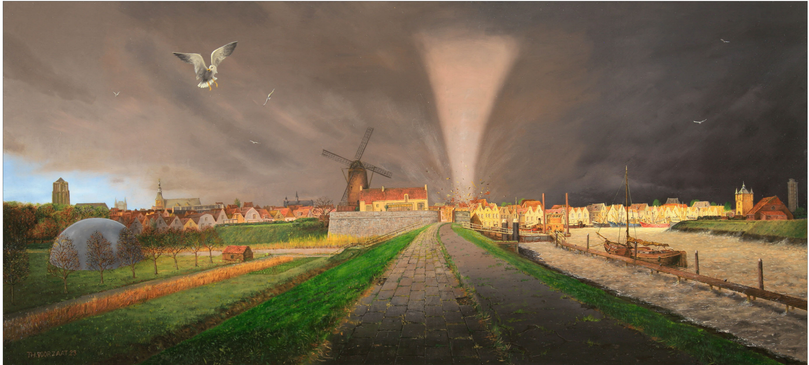
"Windhoos in Zierikzee" 2023 olieverf/paneel 49 x 80,3 cm