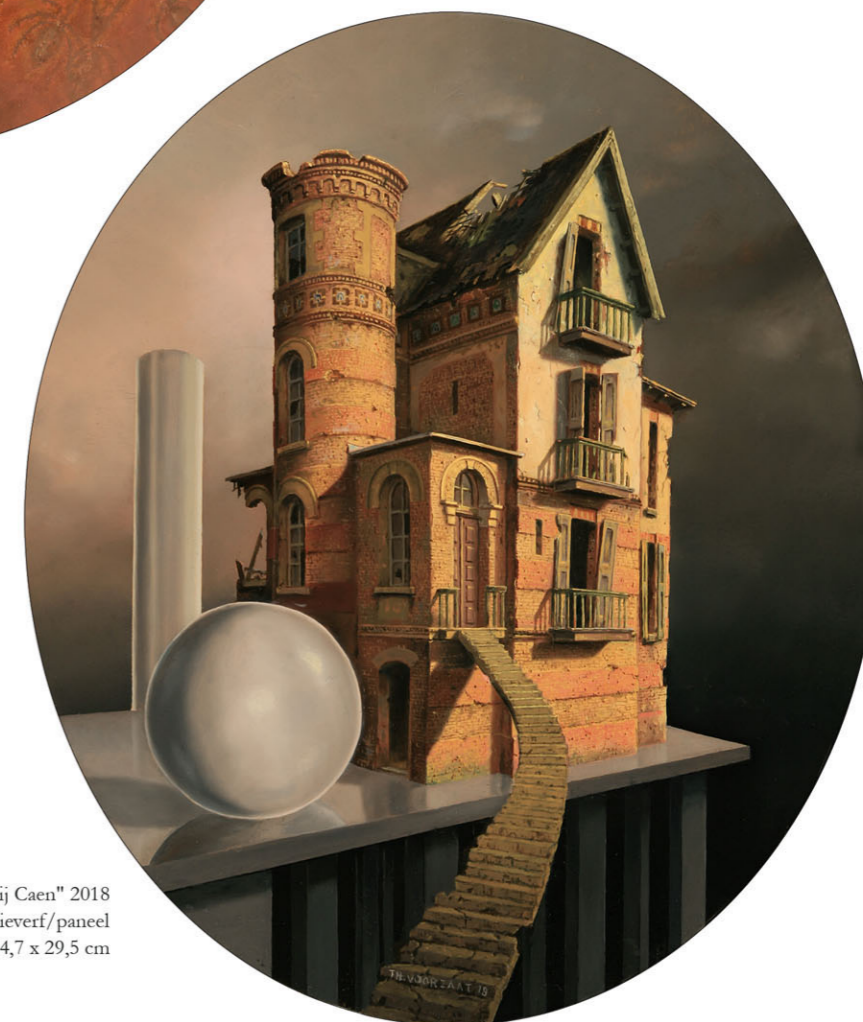
"Stadsgezicht nabij Caen" 2018 olieverf/paneel 34,7 x 29,5 cm

Des te wranger is het dat ik deze woorden noteer, terwijl de wereld opnieuw wordt geteisterd door veelkoppig oorlogsgeweld. Juist omdat ik als tijdens WOII geboren in mijn jeugd doodsbang was voor de dreigingen die de Koude Oorlog in de vorm van een alles vernietigende atoomoorlog in zich droeg, was de Val van de Muur een paradijselijk geschenk. Hoe wrang is het nu te moeten constateren hoe de beste bedoelingen in één ademtocht kunnen uitdraaien op een nog grotere ramp. Hoewel, het kan verkeren. Mijn antwoord op het fatalisme dat de voorgaande stellingname ademt zal u verbazen.