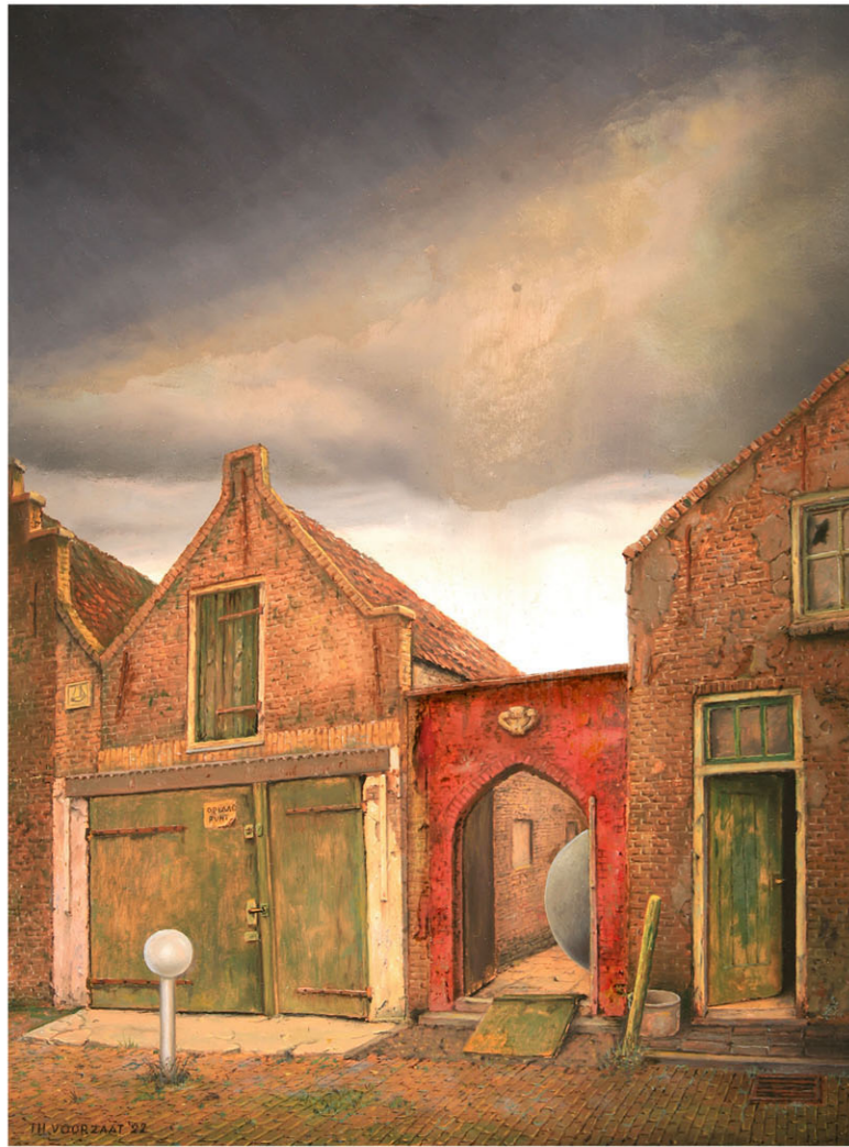
"Vooruitgang in Zierikzee III" 2022 olieverf/paneel 40 x 30 cm