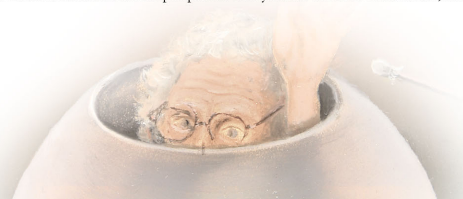
"Rust Roest" 2024 olieverf/paneel 54 x 78,6 cm