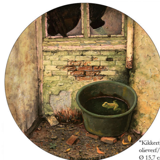
"Kikkertje" 2022 olieverf/paneel Ø 15,7 cm

One thing is certain: Theo Voorzaat in forging what undeniably is an impressive body of work has put a twist of his very own on the way in which the traumas of war can be processed, refusing point-blank to kowtow to the artistically customary habit of adjusting to a standard imposed from above that is both substantive and form-related – I have to tread carefully here, as my words might be misconstrued in that I have allowed myself to pass less favourable judgment on the position taken by differently oriented artists, whereas in actual fact what I am after is identifying the correlation between Theo Voorzaat's works and one of the worst disasters ever to be unleashed upon the world in the 20th century, of which precious little has left its marks on the visual arts of the post-war period other than that the motto "look ahead and prepare, don't look back and regret" was embraced by the art world as it was everywhere else. Not that this is a criticism, but wouldn't it be great to if one of the many art historians there are were to draw inspiration from what has to date remained an unexplored research area?o doornemen, wat verder niets bewijst, maar toch assisteert bij het uitdijen van uw inlevingsvermogen.