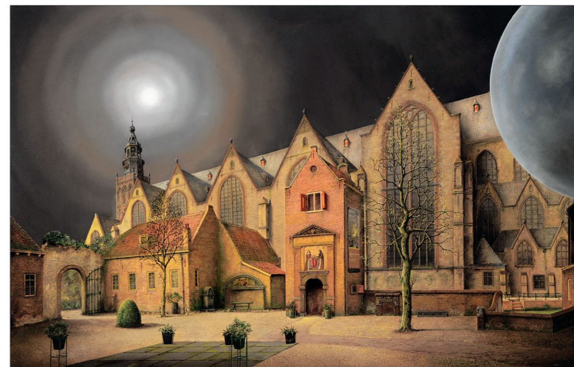
"Museum Gouda" 2023 olieverf/paneel 49,8 x 78 cm