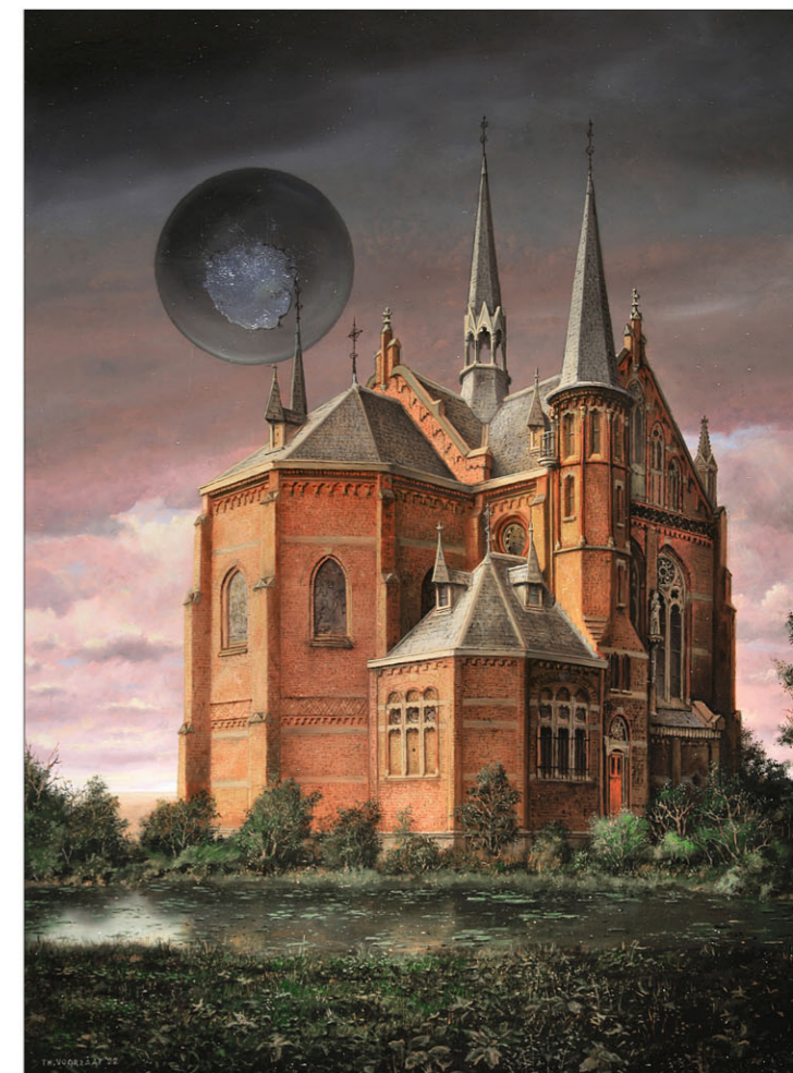
"Klooster Bijdorp - Voorschoten" 2022 olieverf/paneel 45,8 x 33,8 cm