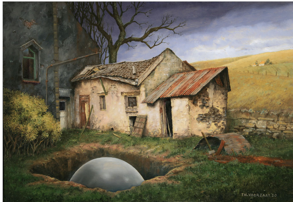
"Schuur in Frankrijk" 2020 olieverf/paneel 21,6 x 31,1 cm

M aar ik dwaal af. Er valt nog veel over te zeggen, wat ik in de nabije toekomst beslist zal doen, maar nu draait het om de tentoonstelling van Theo Voorzaat. Het klinkt als een open deur, maar je moet openstaan voor zijn idioom. Voorzaat heeft in de afgelopen decennia op onnavolgbare wijze vorm weten te geven aan de angst en de vervreemding waarmee de gemiddelde burger - dikwijls ongehoord en gemengeld - is geconfronteerd en laat tegelijkertijd zien hoe je door je eigen werkelijkheid te scheppen kunt ontsnappen aan iets dat zich voordoet als een fatale nachtmerrie, en vraag me niet om dat alsnog toch uit te leggen, maar het klinkt als de schoonheid van een tornado bij een bloedrode ondergaande zon.